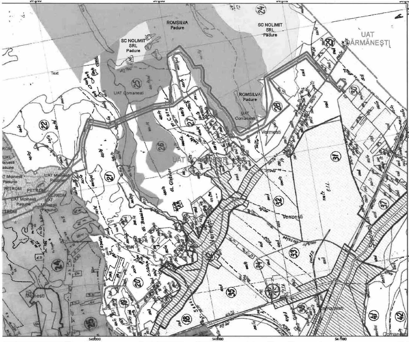
PLAN DE ÎNCADRARE ÎN ZONA PE ORTOFOTOPLAN Scara 1:30000